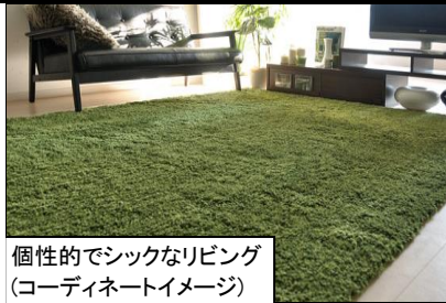
個性的でシックなリビング (コーディネートイメージ)